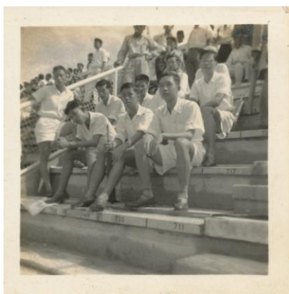
1957 年 8 月 31 日，早上八点。 华中篮球队在吉隆坡默迪卡体育馆见证了国家的独立。

8 月底，斗志高昂的华中篮球队浩浩荡荡的前往吉隆坡，为具有建国含意的篮球赛继续奋战。