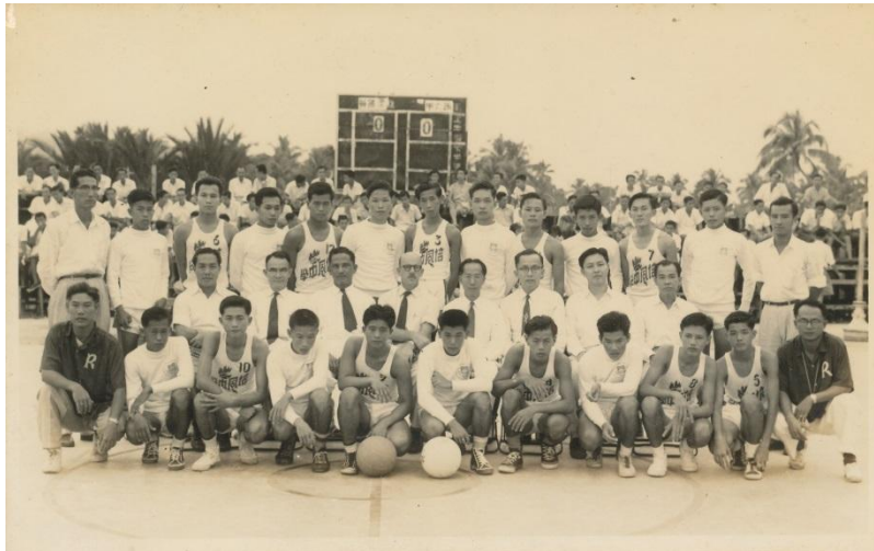
峇株华侨中学与马六甲培风中学篮球队合影。

华中，就在这配合马来亚独立庆典而举办的“默迪卡”校际篮球赛中，努力的向吉隆坡迈进。在争夺南区盟主赛事中，华中先是战胜新山宽柔中学，成绩为 57 比 42 3 。接着在盟主争夺赛中，华中打败了马六甲培风中学并成为南区盟主。